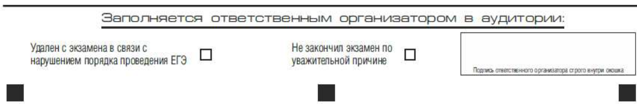
Рис. 6. Область для отметок организатора в аудитории о фактах удаления участника экзамена либо об окончании экзамена по уважительной причине

Заполнение полей (рис. 6) организатором в аудитории обязательно, если участник экзамена удален с экзамена в связи с нарушением установленного порядка проведения ЕГЭ или не завершил экзамен по объективным причинам. Отметка организатора в аудитории заверяется подписью организатора в специально отведенном для этого поле бланка регистрации, и вносится соответствующая запись в форме ППЭ-05-02 «Протокол проведения ГИА в аудитории». В случае удаления участника экзамена в штабе ППЭ в зоне видимости камер видеонаблюдения заполняется форма ППЭ-21 «Акт об удалении участника экзамена».