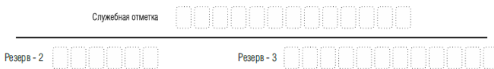
Рис. 5. Поля для служебного использования

Поля для служебного использования «Служебная отметка», «Резерв-2» и «Резерв-3» не заполняются.